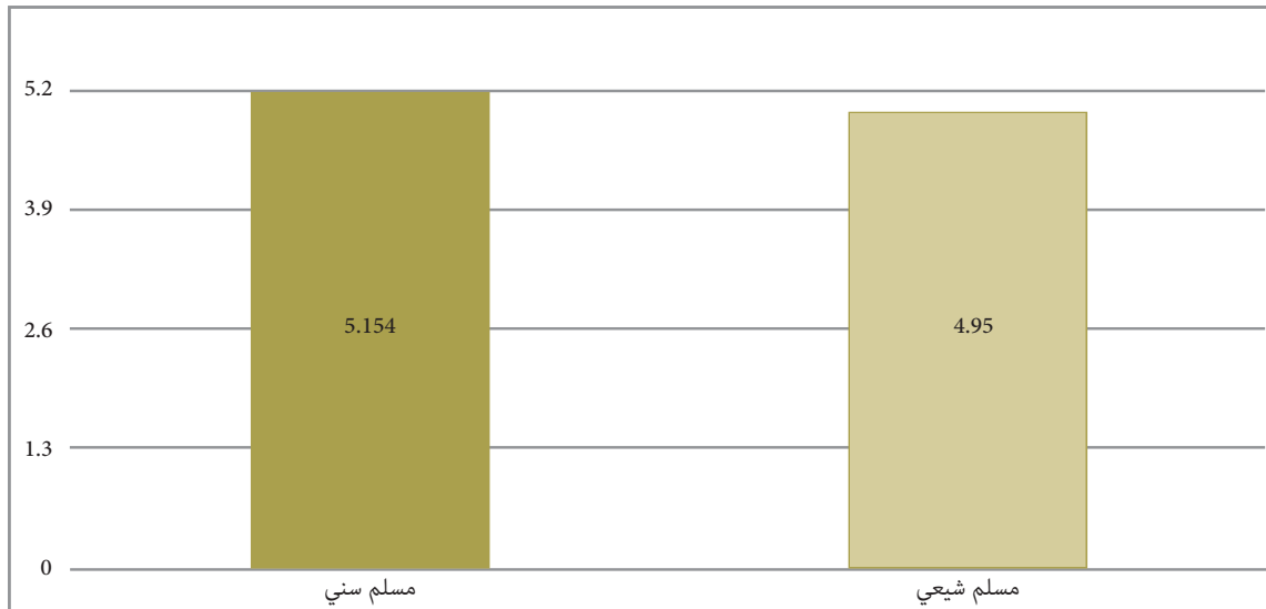
الشكل (3) مؤشر الطاقة

بعد ذلك، جرى اعتماد هذا المقياس الطائفي الجديد بغية استخدام الانحدار اللوجستي المتعدد الحدود Multinomial Logistic Regression، لمعرفة ما إذا كان المقياس الجديد الذي يركّز على